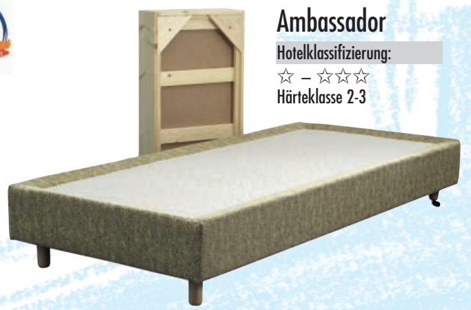
Ambassador Hotelklassifizierung: ☆ – ☆☆☆ Härteklasse 2-3