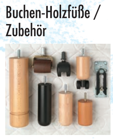
Buchen-Holzfüße / Zubehör