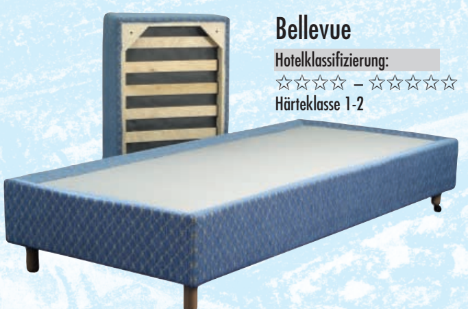
Bellevue Hotelklassifizierung: ☆☆☆☆ – ☆☆☆☆☆ Härteklasse 1-2