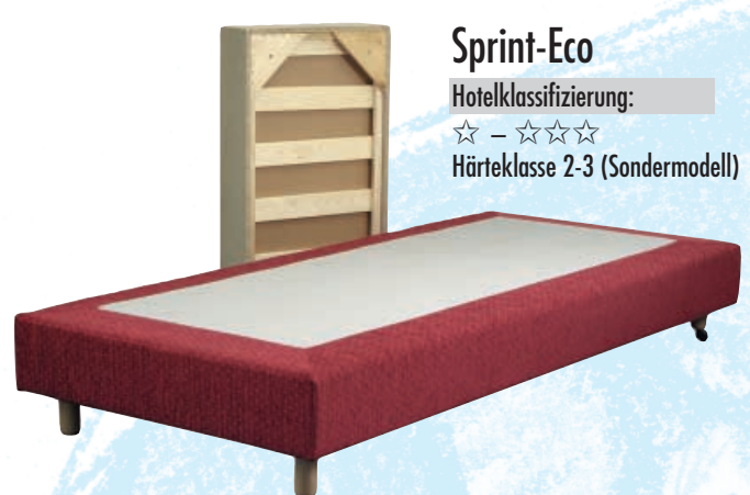
Sprint-Eco Hotelklassifizierung: ☆ – ☆☆☆ Härteklasse 2-3 (Sondermodell)