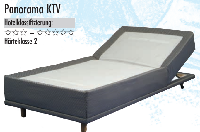
Panorama KTV Hotelklassifizierung: ☆☆☆ – ☆☆☆☆☆ Härteklasse 2