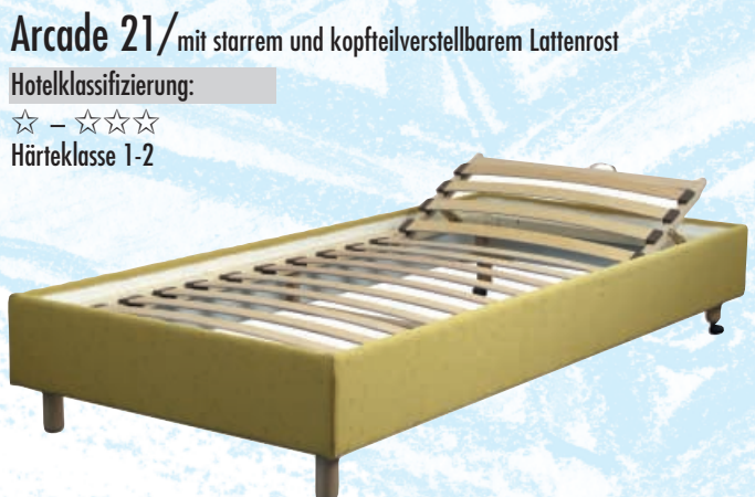
Arcade 21/ mit starrem und kopfteilverstellbarem Lattenrost Hotelklassifizierung: ☆ – ☆☆☆ Härteklasse 1-2