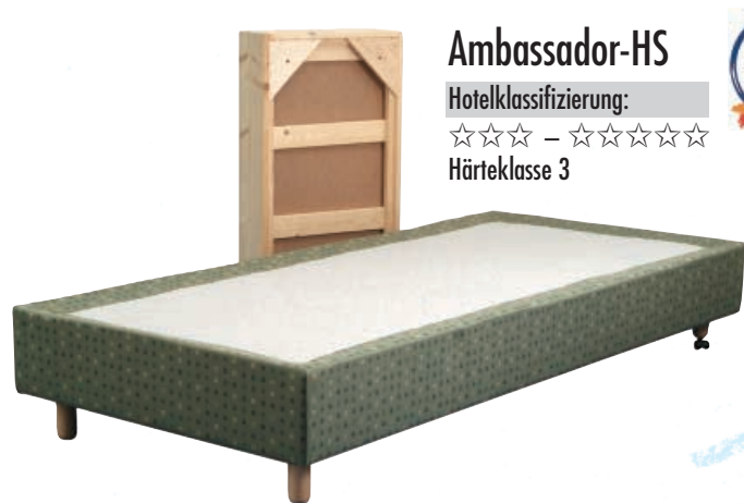
Ambassador-HS Hotelklassifizierung: ☆☆☆ – ☆☆☆☆☆ Härteklasse 3